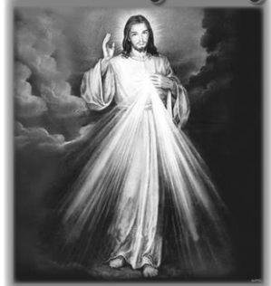
Jesus I Trust In You